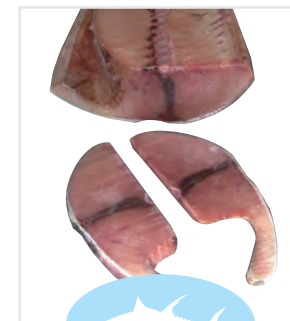
Rabil (Aleta amarilla)