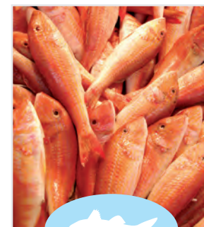
Salmonete de roca